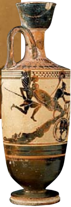
Achille traînant le corps d'Hector Peintre de Diosphos, Athènes, vers 490 av. J.-C. Musée du Louvre, Antiquités grecques, étrusques et romaines